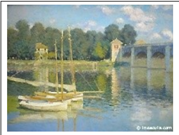
Le pont d'Argenteuil Henri MATISSE

La conférencière nous a présenté des tableaux de Claude Monet, d'Henri Matisse et d'André Derain. Nous avons croqué (dessiné) des tableaux.